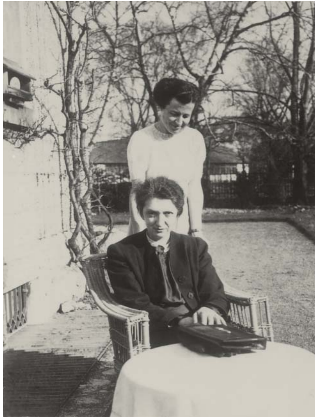
Die Pianistin Clara Haskil, 1945 in Winterthur.